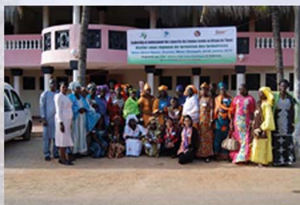
Phot :Vue des participantes à l'atelier de Vélingara

A la suite de cet atelier sous-régional, trois (3) ateliers locaux ont été organisés à Bambilor (Niayes), à Podor (Nord du Sénégal) et à Vélingara (Sud du Sénégal) en 2015. Au Bénin et Mali deux ateliers ont été organisés par les partenaires du projet à savoir FDS et OBEPAB. Chaque atelier a vu la participation d'une vingtaine de femmes rurales. L'objectif était de renforcer les capacités en leadership de ces femmes pour une meilleure prise en charge de leurs préoccupations à travers la démultiplication de la formation reçue à Somone.