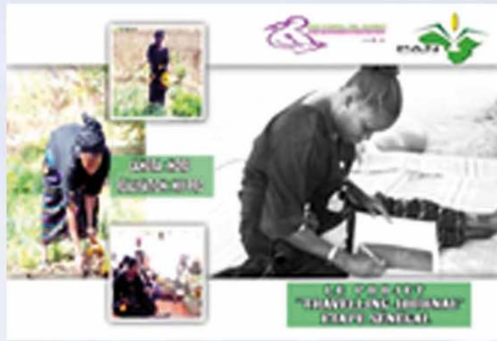
Photo : Pochette journal de voyage