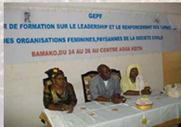
Photo : Atelier organisé au Mali