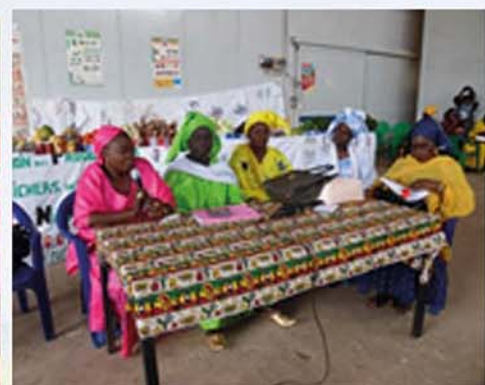
Photo : Journée Internationale de la femme 2015