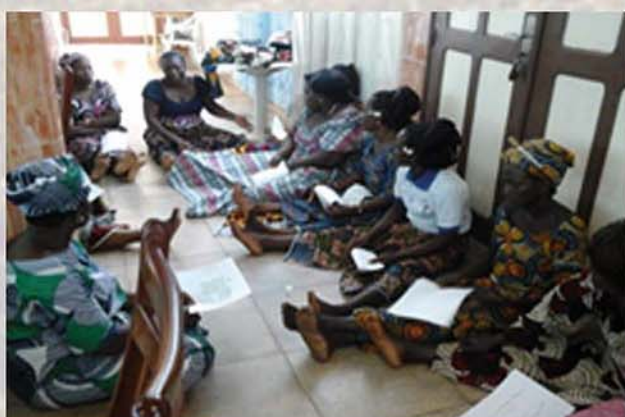
Photo: Vue des participantes à l'atelier au Bénin