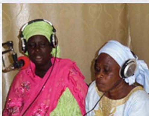
Photo : Journée Femme Rurale 2015

Pan Africa a également organisé des campagnes et des activités (conférence de presse, forum, émissions radiophoniques, panels...) de plaidoyer au niveau local, national et international. Ainsi, la journée internationale de la femme a été célébrée chaque 08 Mars de même que la journée internationale des femmes rurales en 2015.