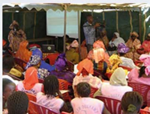
Photo : Journée internationale de la femme 2014