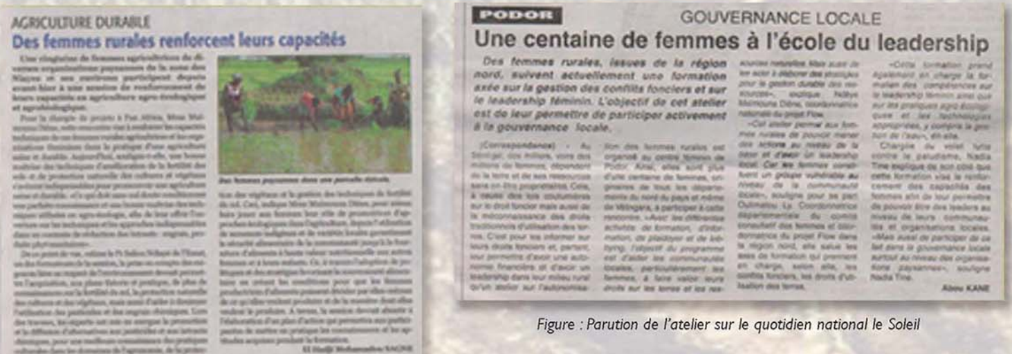
Figure : Publication de l'atelier sur le quotidien soleil