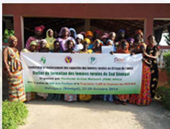
Photo: Vue des participantes à l'atelier de Vélingara